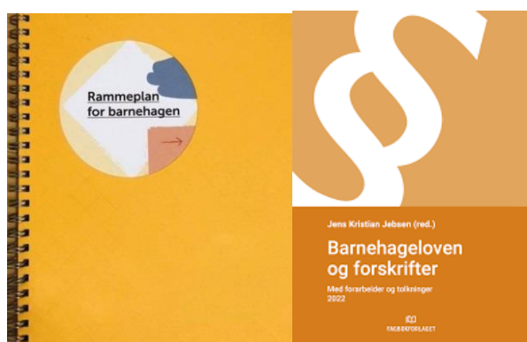
Figur 1 Bilde av rammeplan for barnehagen og lov om barnehagen

Videre har Holmestrand kommune planer og føringer som styrer barnehagen i forhold til økonomi, personale, informasjon- og fagutvikling.