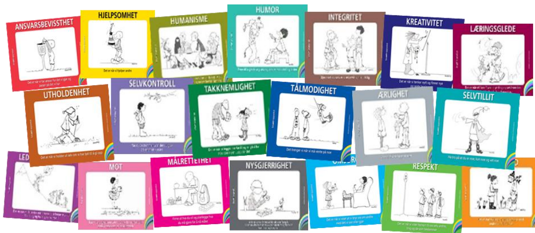
Figur 3 Bilder av de 20 SMART-egenskapene

Gjennom SMART arbeider vi med å utvikle livsmestringskompetanse, vennskap og fellesskap, og har fokus på de positive hendelsene i det sosiale samspillet i barnehagen. Vi ønsker å bidra til at barn kan oppleve gode relasjoner med andre, og bli bevisste på sosiale egenskaper som kan fremme vennskap og fellesskap i barnehagen. Sosial kompetanse er ferdigheter, kunnskaper og holdninger som gjør det mulig å etablere og vedlikeholde sosiale relasjoner. Vi ønsker at barna skal bli kjent med egne og andres følelser. Barna skal øve på å hevde seg på en god måte og å lese lekesignaler fra andre. Barna skal vise empati og kunne utføre handlinger for å hjelpe andre.