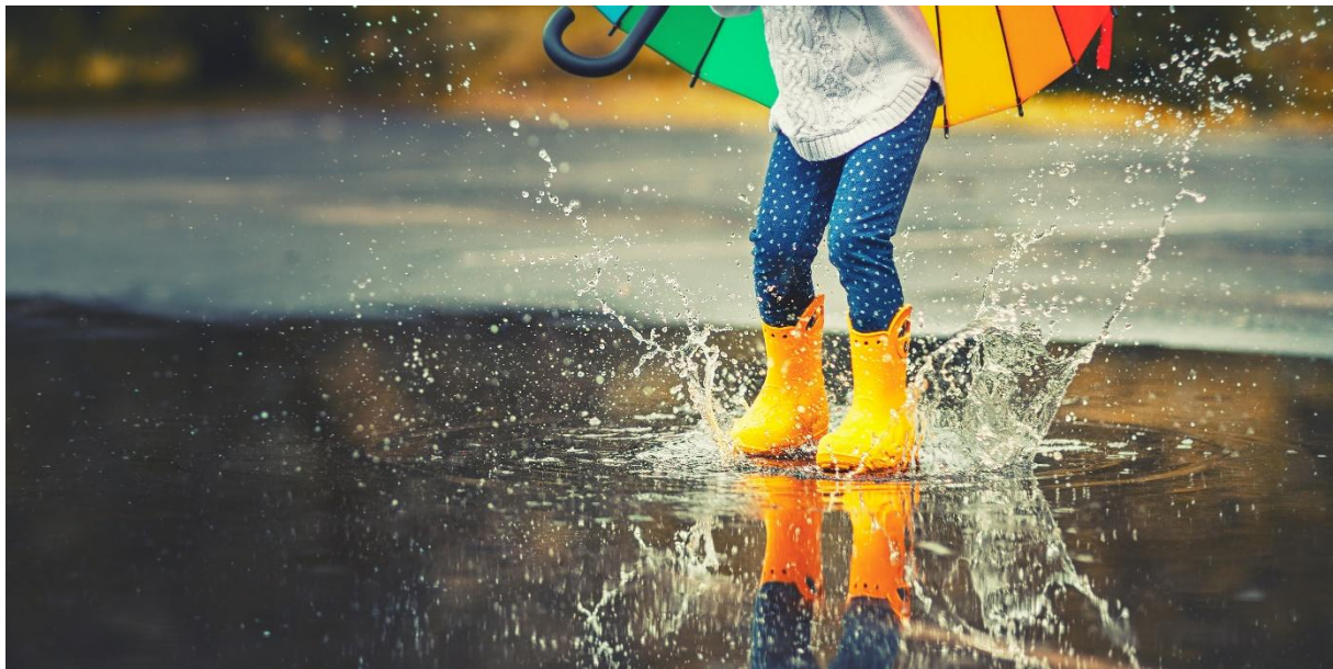
Figur 6 - Barn som hopper i vanddam