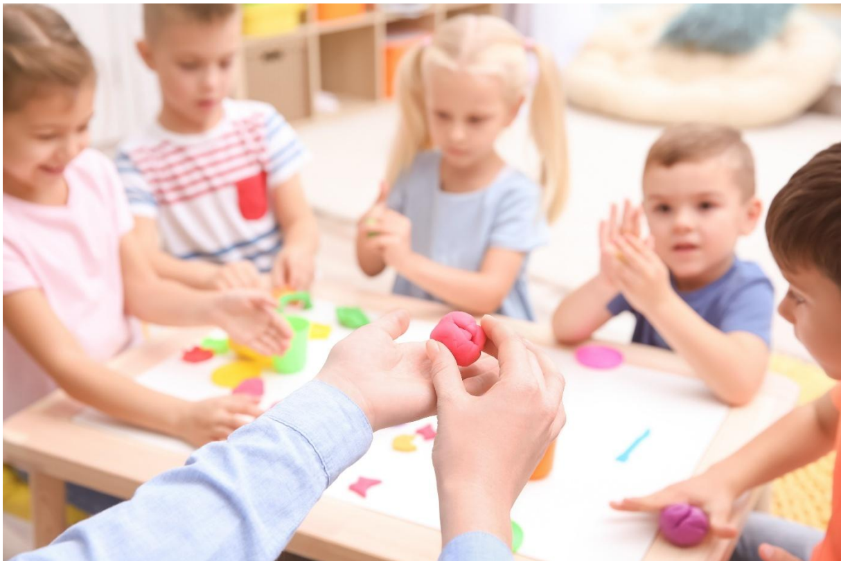
Figur 1 - barn som leker med modelleire

Oppvekstløftet i Holmestrand - Holmestrand kommune