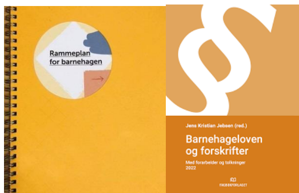
Figur 1 Bilde av rammeplan for barnehagen og lov om barnehagen

Videre har Holmestrand kommune planer og føringer som styrer barnehagen i forhold til økonomi, personal, informasjon- og fagutvikling.