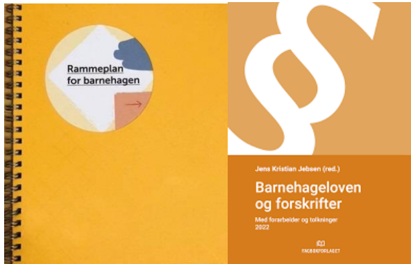
Figur 1 Bilde av rammeplan for barnehagen og lov om barnehagen

Videre har Holmestrand kommune planer og føringer som styrer barnehagen i forhold til økonomi, personal, informasjon- og fagutvikling.