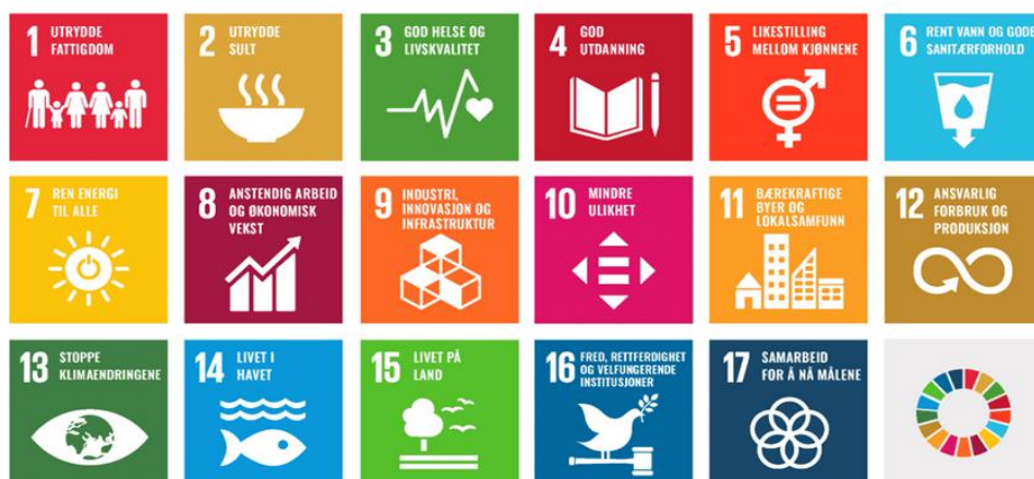
Figur 4: FNs bærekraftsmål.

I forrige versjon av de nasjonale forventninger ble det tydeliggjort bærekraftmålene skulle bli en del av grunnlaget for samfunns- og arealplanleggingen. Dette fokuset er videreført i gjeldende versjon av dokumentet. Det er poengtert at forventningene i dokumentet viser retning for hvordan bærekraftmålene kan følges opp i planleggingen.