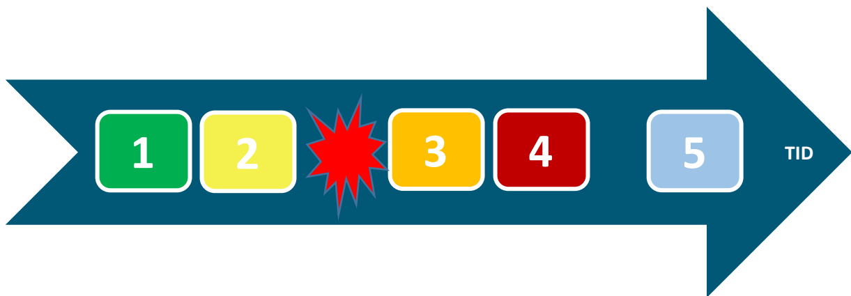
Figur 3 Beredskapsnivåer i Holmestrand kommune

Beredskapsprinsippene gjenspeiles i de ulike beredskapsnivåene i Holmestrand kommune. Disse er illustrert i figur 3 som fem nivåer innenfor en tidsakse.